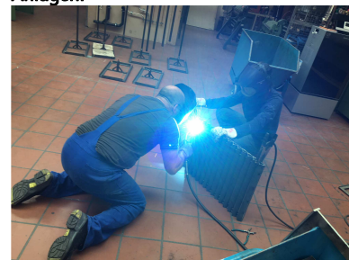
Bei Metal-Performance ging es heiß her